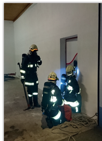
Atemschutzübungen im Jahr 2017