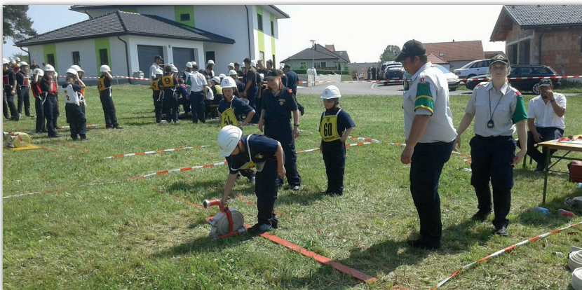
Bezirksbewerb Neukirchen am Ostrong