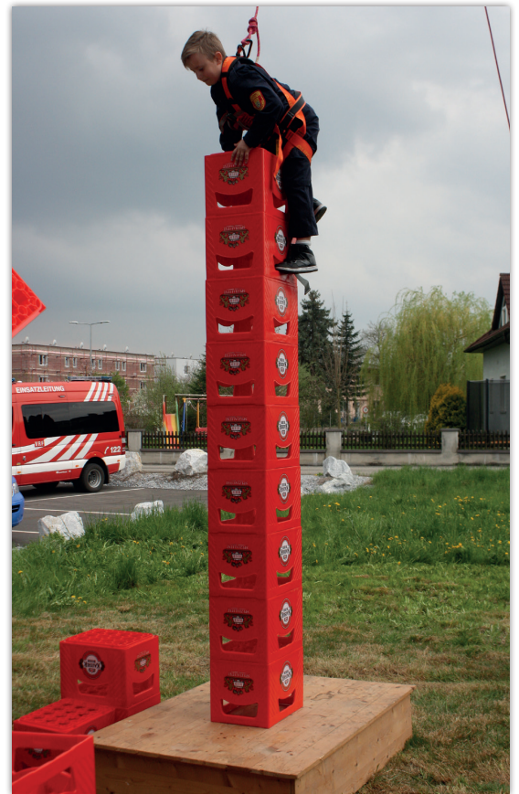
Wissenstest Klein Pöchlarn